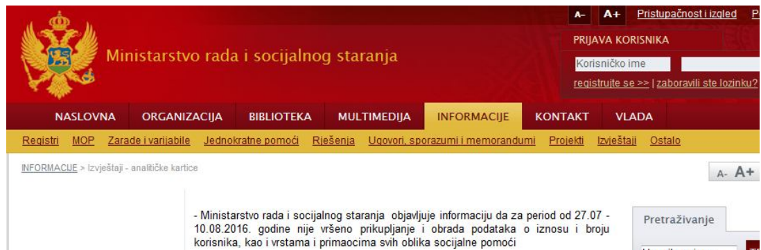
Slika 8: Obavještenje Ministarstva rada i socijalnog staranja o analitičkim karticama o socijalnim davanjima u periodu od 27. 07. – 10. 08. 2016. godine.

U drugom izvještajnom periodu je Ministarstvo je na internet stranici navelo da „nije vršeno prikupljanje i obrada podataka o iznosu i broju korisnika, kao i vrstama i primacima svih oblika socijalne pomoći“.