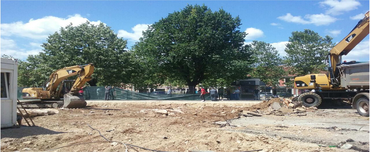
U Nikšiću je rekonstrukcija Trga Slobode bila najveća investicija realizovana u izbornom periodu

Opština Kotor je u izbornom periodu prosječno mjesečno trošila 210 hiljada i ukupno za tri mjeseca potrošila 630 hiljada eura, za razliku od neizbornog perioda kada je mjesečno trošila u prosjeku 69 hiljada eura i za pola godine potrošila 450 hiljada eura, pa je na njenom primjeru uvećanje od tri puta.