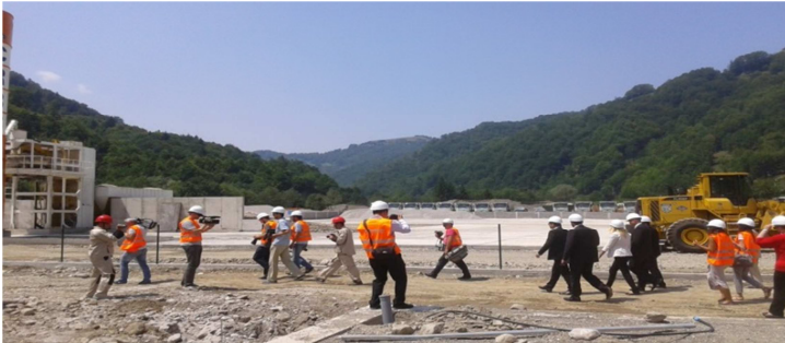
Gradilište autoputa je trenutno najveće u zemlji

I: UVOD: Izdaci za eksproprijaciju zemljišta građanima, koje država isplaćuje u zamjenu za zemljište koje uzima u vlasništvo zbog izgradnje infrastrukturnih projekata, značajno su uvećani u septembru 2016. godine, kada je po tom osnovu isplaćeno 800 hiljada eura, što se poklopilo sa periodom neposredno prije održavanja parlamentarnih izbora u Crnoj Gori. 1