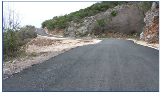
Ilustracija: Asfaltirani put

Uoči oktobarskih parlamentarnih izbora Ministarstvo održivog razvoja je kroz kapitalni budžet značajno uvećalo izdatke za lokalnu infrastrukturu, što je prikazano kroz studiju u nastavku.