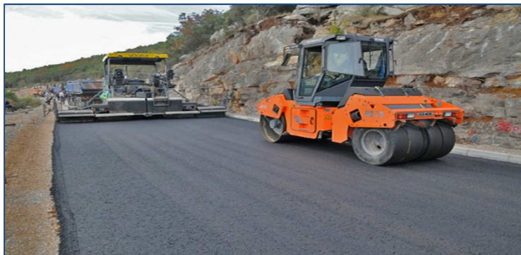
Ilustracija: Presvlačenje asfalta

I: UVOD: Direkcija za saobraćaj, koja je pod nadležnošću Ministarstva saobraćaja, je zadužena za realizaciju kapitalnog budžeta koji se odnosi na izgradnju i rekonstrukciju regionalnih i magistralnih puteva. Pored toga, ova Direkcija finansira investiciono presvlačenje asfalta, što je projekat koji se realizuje u takozvanih pet sekcija koje su teritorijalno označene, odnosno Podgorici, Nikšiću, Pljevljima, Beranama i Kotoru. 1