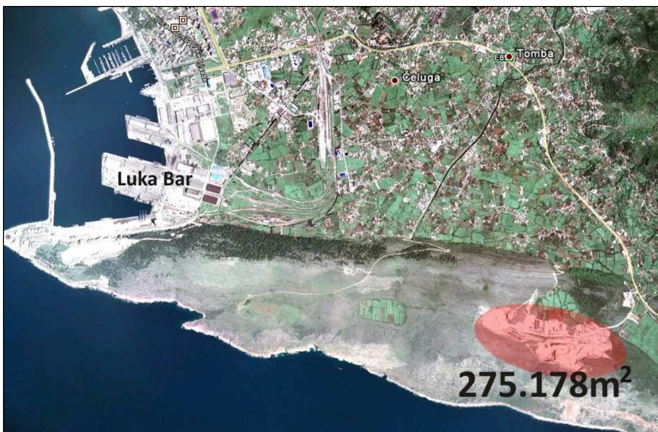
Lokacija sporne parcele

Omot spisa za spornu parcelu broj 1913/2, katastarska opština Zaljevo, Bar, ne sadrži bilo kakav pravno valjani dokument na osnovu kojeg je bilo moguće tu parcelu uknjižiti kao svojinu ZIB-a. Ono što omot spisa sadrži jeste upis tereta restitucije u korist Perazić Smiljke i ostalih, kao i teret Morskog dobra. Pored ovoga, uknjižen je teret nekoliko hipoteka koje su godinama stavljane na ove nepokretnosti kako bi ZIB dobio kredite.